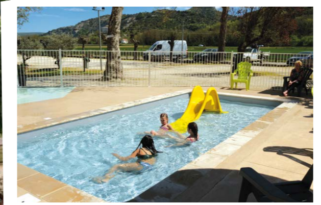
1 JARDIN D'EAU WATER GARDEN