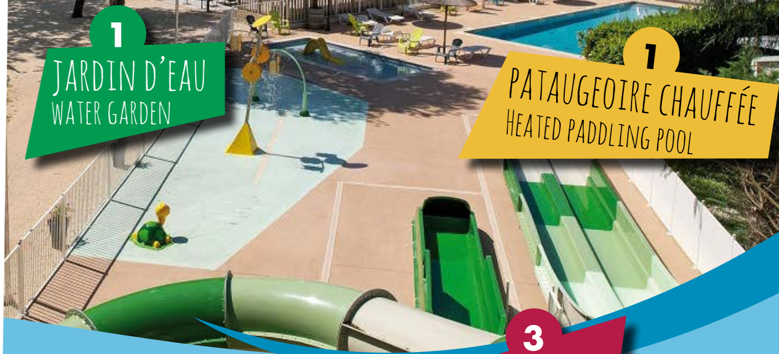
3 TOBOGGANS SLIDES