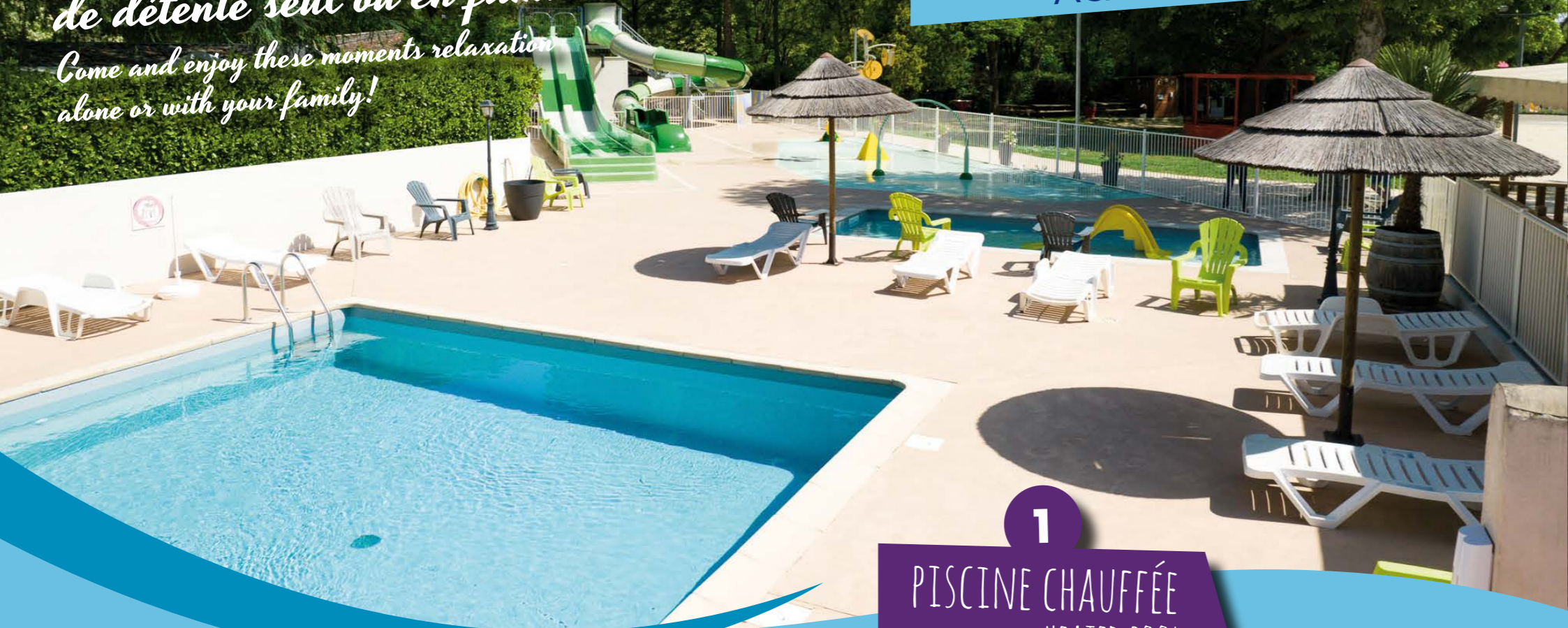
1 PISCINE CHAUFFÉE HEATED POOL